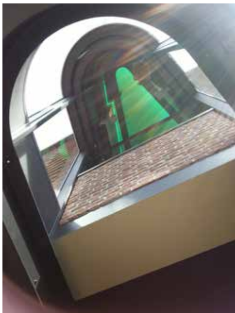
Gebogen Glas en groen lichtval in de toren