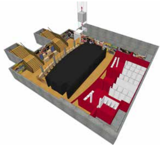
Axonometrie, doorbraak naar kelder bestaande gebouw met twee trappen en een lift