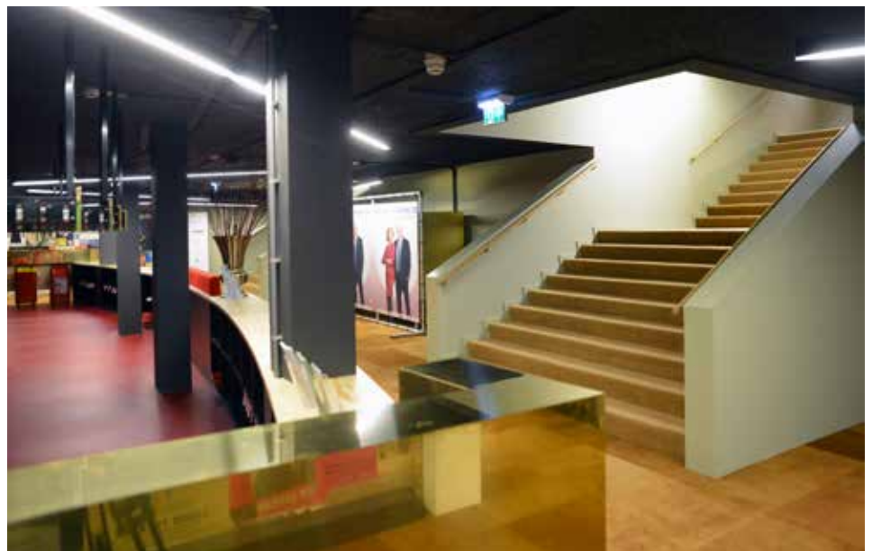
Garderobe balie kelder