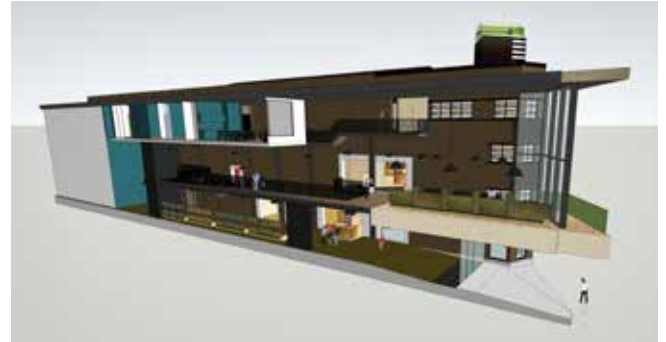
Axonometrie, uitbreiding Artiestenruimtes op tweede verdieping