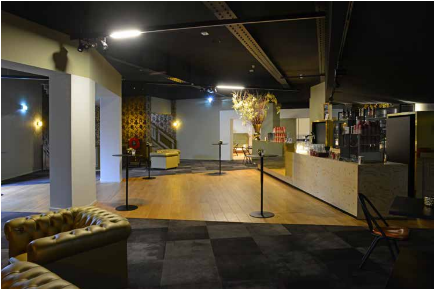
Publieksfoyer eerste verdieping