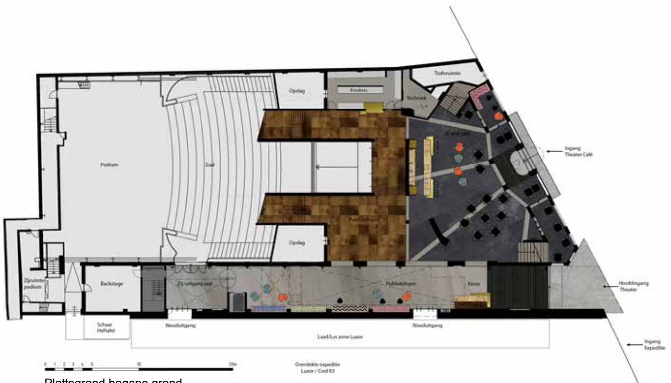
Plattegrond begane grond