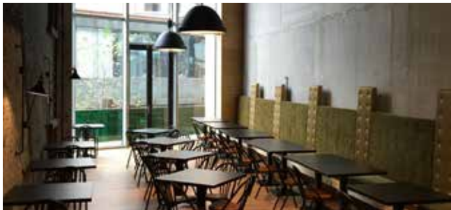
Publieksfoyer, eerste verdieping uitbreiding