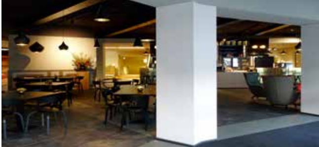
Café, begane grond bestaande gebouw