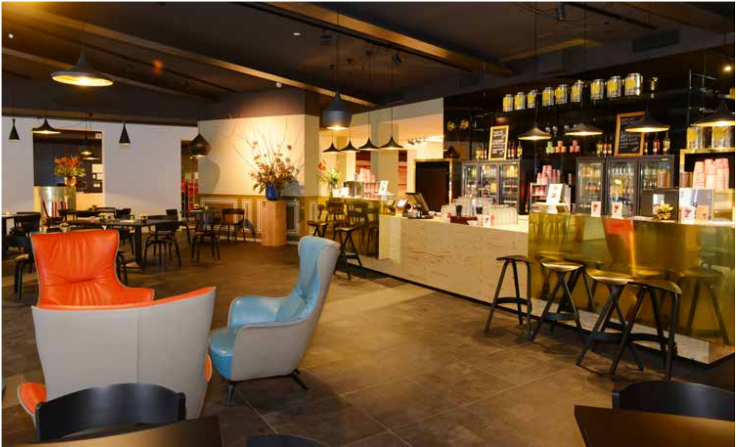
Theater Café begane grond

“De architectuur gaat niet over ontwerp, maar over emotie.”