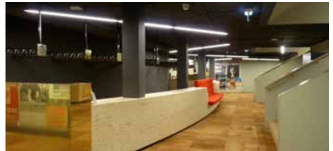
Garderobe, kelder bestaande gebouw