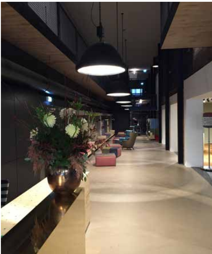
Kassa begane grond