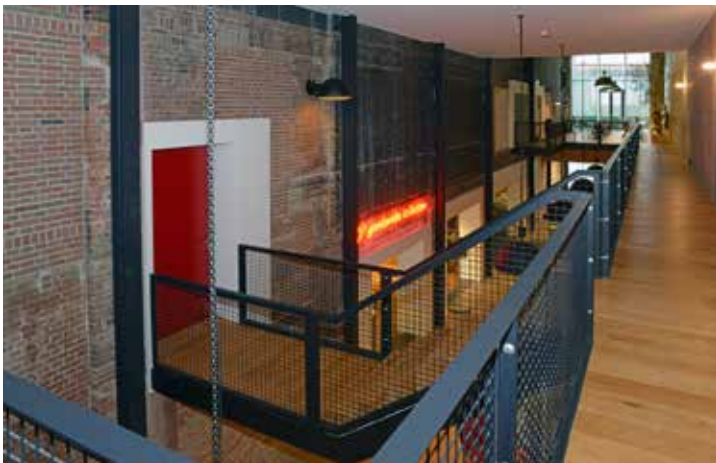
Passerelle uitbreiding