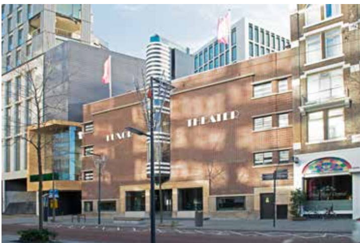
Gevel Kruiskade

“De architectuur gaat niet over ontwerp, maar over emotie.”