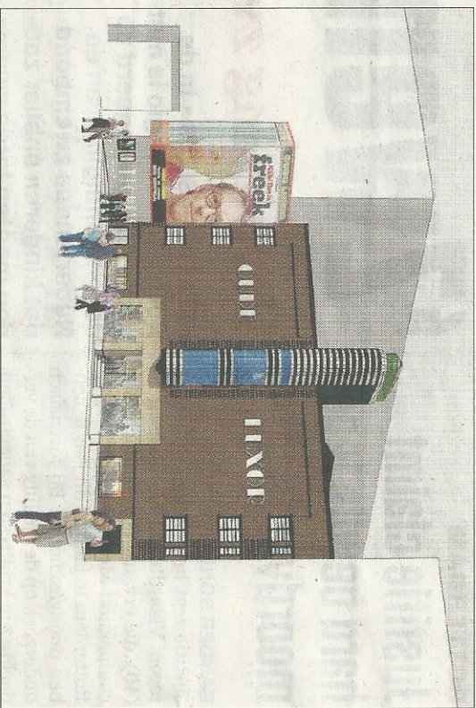
Zo moet het oude Luxor Theater er volgende jaar december uitzien, met torentje en nieuwe entree links. ILLUSTRATIE AUDE DE BROISSIA