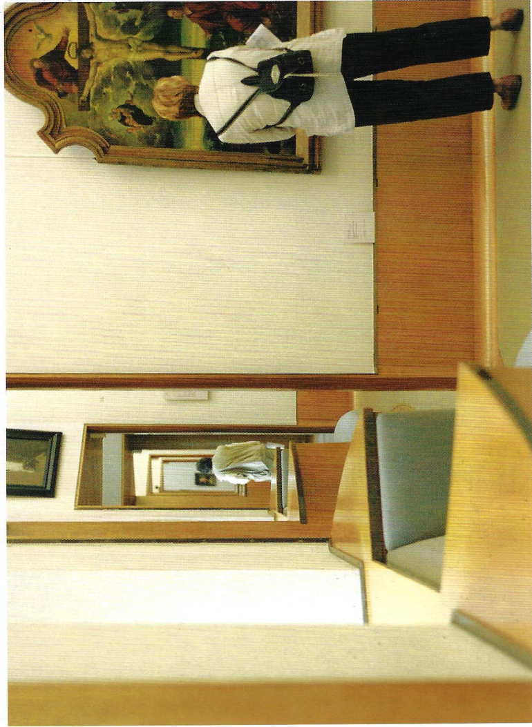
Favourite Museum Boijmans Van Beuningen, architect A. van der Steur, 1935