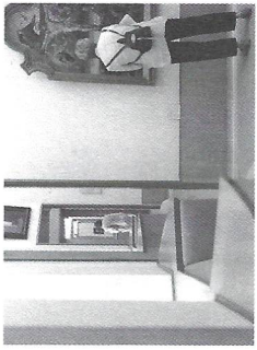
Favourite Museum Boijmans Van Beuningen, architect A. van der Steur, 1935